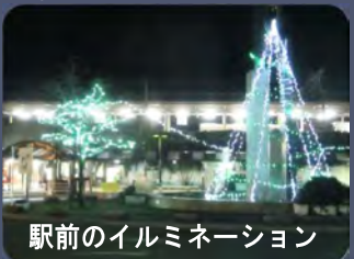
駅前のイルミネーション

★今冬、穂積駅前で点灯されたイルミネーションも君たちの先輩の提案から生まれました。