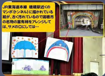
JR東海道本線 穂積駅近くのマンガ(トンネル)に描かれている絵が、古く汚れているので瑞穂市の名物の富右衛門をアレンジしては、サメの口にしては...

★今冬、穂積駅前で点灯されたイルミネーションも君たちの先輩の提案から生まれました。