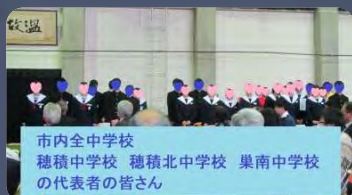
市内全中学校 穂積中学校 穂積北中学校 菓南中学校 の代表者の皆さん

●あなた達の提言は、会場におられた自治会／行政／教育等の多方面の大人達が会議や会合の場で話題に取り上げ、実現に導く手助けをしてくれるでしょう。ご期待下さい。