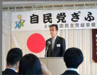
9/9 第7期 自民党ぎふ政治塾に入塾