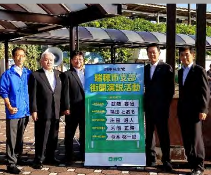
9/25(月)今回より活動参加者名の入った看板が登場

でも、スマートフォン 1 の無料ア プリ(FixMyStreetJapan)を利用し 地域の課題・問題に取り組んで います。同様なシステムを採用 する自治体が増えていきます。 また、先進地事例において、 通報が入る時間帯を調べますと、 役所が開いている時間帯より、 夜間など閉庁している時間帯の通 報件数が多い傾向があります。 やはり、夜間でも対応する24時 間受付できるこのようなシステ ムが必要であり、市民協働の観 点からも、携帯端末のスマート フォンやパソコンを使って市民 の方が簡単に通報できるシステ ムの導入を求め質問を致しまし た。