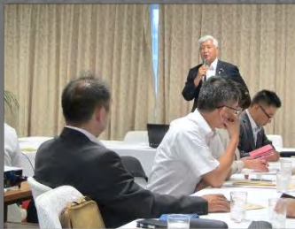
7/25~26 自民党県連・青壮年議員連盟による東京研修