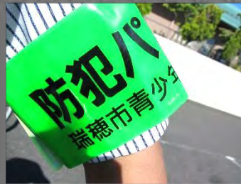
9/1 「あいさつ運動」(2学期の始まり)