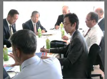
10/3~4 文教厚生委員会視察(淡路市・広島県北広島町)